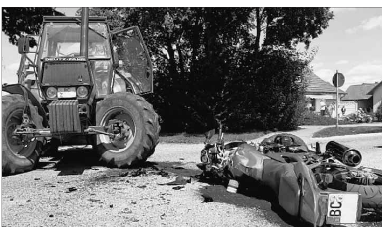
UNLINGEN (sz) - Bei einem Unfall ist gestern mittag in Unlingen ein Motorradfah- rer schwer verletzt worden. Von der Ortsmitte aus fuhr er Richtung Riedlingen und prallte dabei gegen einen aus einem Feldweg kommenden Traktor. Er musste mit einem Hubschrauber in eine Ulmer Klinik geflogen werden.